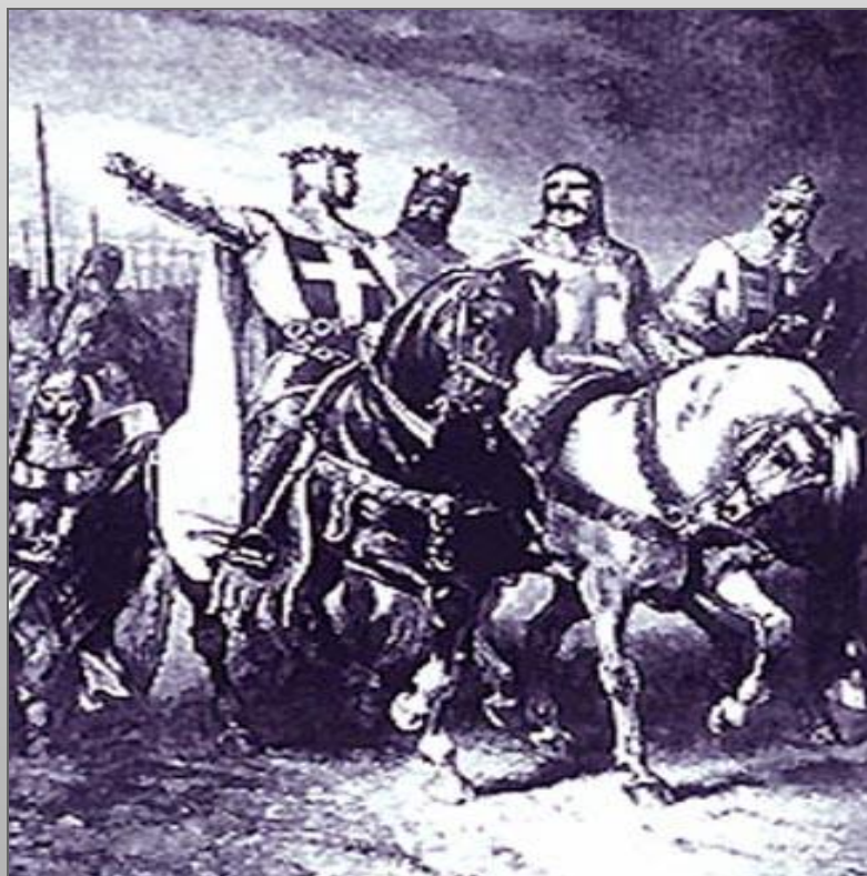
Na romantizujúcej kresbe z 19. storočia sú účastníci prvej križovej výpravy: zľava Godefroi z Bouillonu, Raimond z Toulouse, Bohemund z Tarentu a Tancred