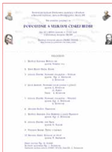
Plagáty prvej umeleckej výstavy a koncertu v UK PU