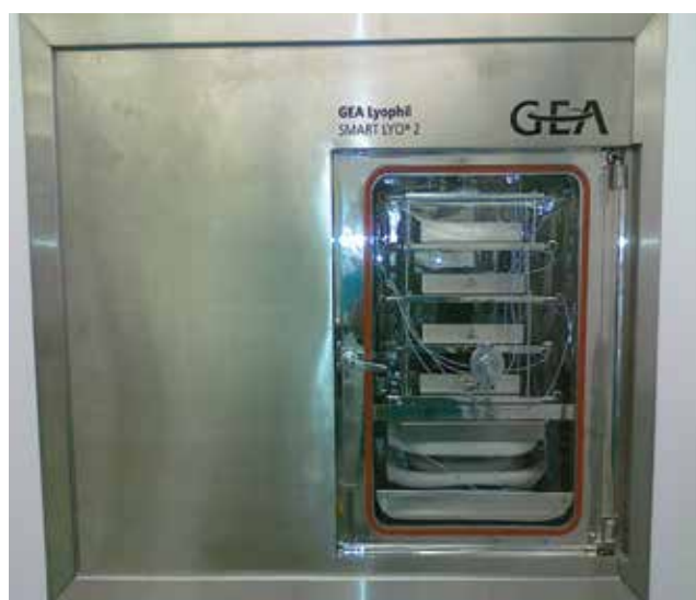
Priebeh lyofilizácie – extrakt z plodov liečivých rastlín je naplnený vo fľaštičkách a umiestnený v lyofilizátore