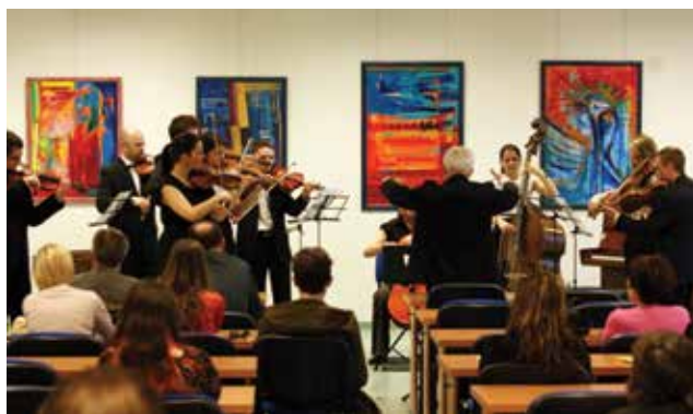
Jarný koncert komorného orchestra PU Camerata Academica (2013)

Samostatnou kapitolou je spolupráca so študentmi, ktorí vyvíjajú bohatú umeleckú činnosť – hudobníci realizujú v UK PU svoje individuálne (diplomové) aj spoločné koncerty, výtvarníci rôzne kolektívne, či individuálne výstavy, literáti usporadúvajú verejné čítania (Vianoč-